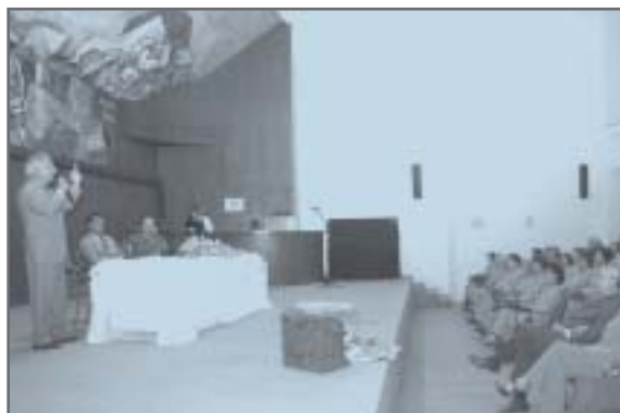
Auditório do Anexo I do TJMG