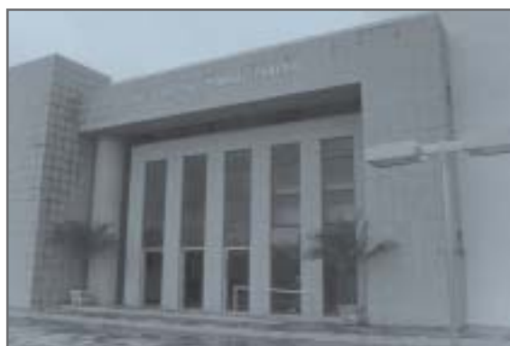
Juizado Especial Criminal Central - Comarca de Belo Horizonte