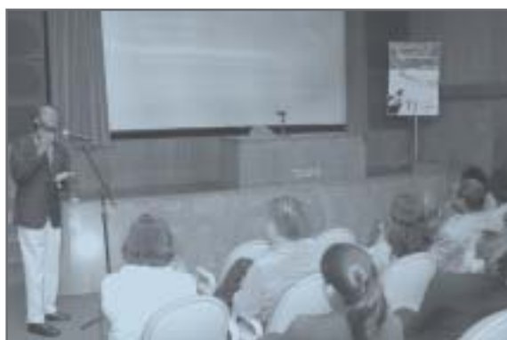
Auditório do Anexo II do TJMG - Projeto Pensa TJ