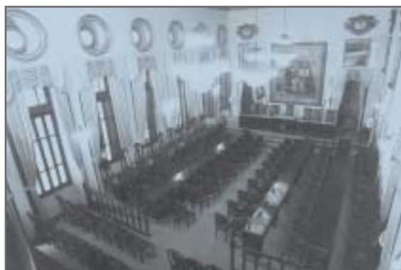
Salão Nobre - Palácio da Justiça "Rodrigues Campos"