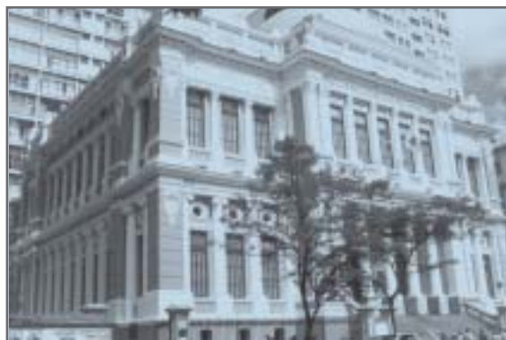
Palácio da Justiça "Rodrigues Campos", sede do Tribunal de Justiça de Minas Gerais, construído em 1910.