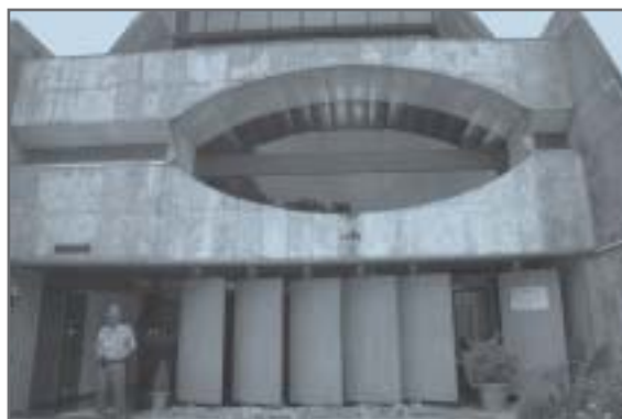
Corregedoria Geral de Justiça