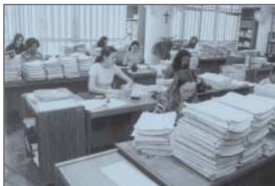
Secretaria de Câmara do TJMG