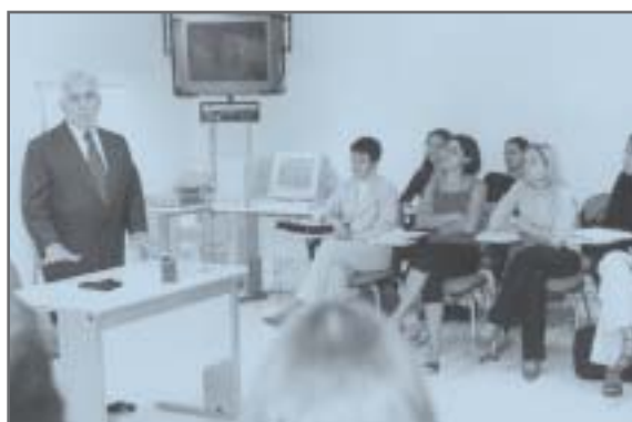
Sala de aula da EJEF