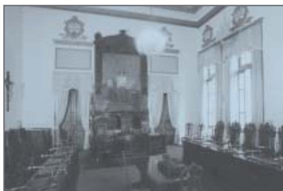
Salão da Corte Superior - Palácio da Justiça "Rodrigues Campos"