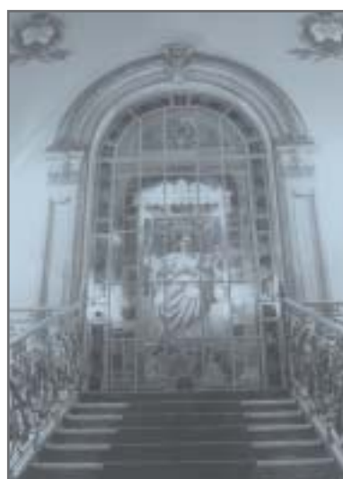
Vitrail "A Justiça", de L. Piscini, confeccionado pela Casa Conrado, São Paulo, em 1911 - Palácio da Justiça "Rodrigues Campos"

"Temos condição de transformar o Judiciário, agilizar as decisões. Podemos acabar com esse mundo de papel, implantar o processo eletrônico, condensado em CD, ou disquete, ou mesmo em DVD. E é preciso ousar, agir, sonhar alto e fazer o sonho transformar-se em realidade. A medida de um homem é o tamanho do seu sonho. Ele precisa ser capaz de ter ideal e visão de futuro."