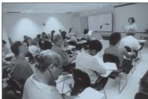
Sala de aula da EJEF