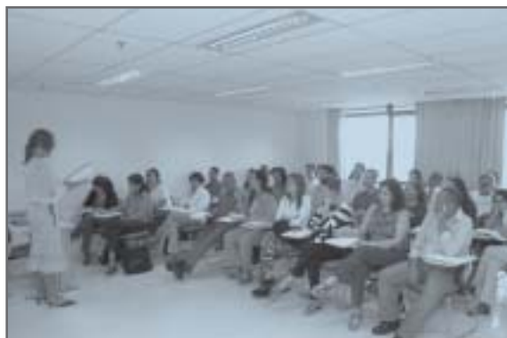
Sala de aula da EJEF