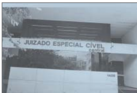
Juizado Especial Cível - Comarca de Belo Horizonte