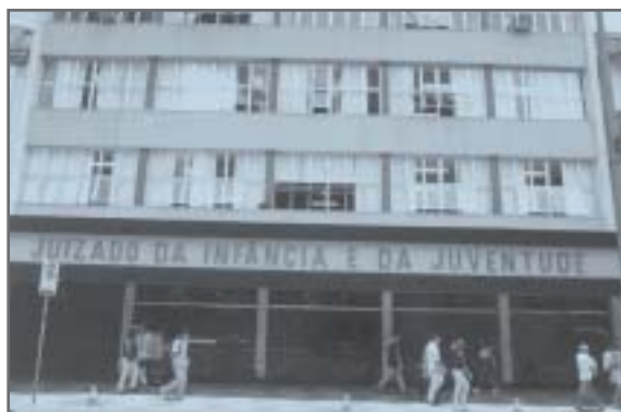
Juizado da Infância e da Juventude - Comarca de Belo Horizonte