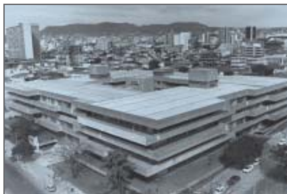
Fórum Lafayette - Comarca de Belo Horizonte (vista externa)