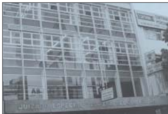
Juizado Especial das Relações de Consumo - Comarca de Belo Horizonte